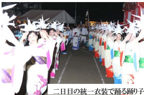
二日目の統一衣装で踊る踊り子

二日目は浴衣に統一。飛び入り参加も受け東日本大震災の供養踊りを兼ねた大会とした。