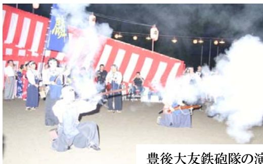
豊後大友鉄砲隊の演武

両日も19時05分から豊後大友鉄砲隊の祝砲で開幕、開会式の後、同19時30分からしっとりとした「猿丸太夫」に始まり軽快なテンポの「左衛門」を踊った。初日は例年通り、団体ごとに手造りした豪華な衣装で大会を盛り上げた。